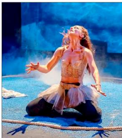
Quatre comédiens interpréteront des personnages habités par le désir.

■ Contact : Tél. 02 48 82 11 33. Tarifs : 15 € et 5 €.